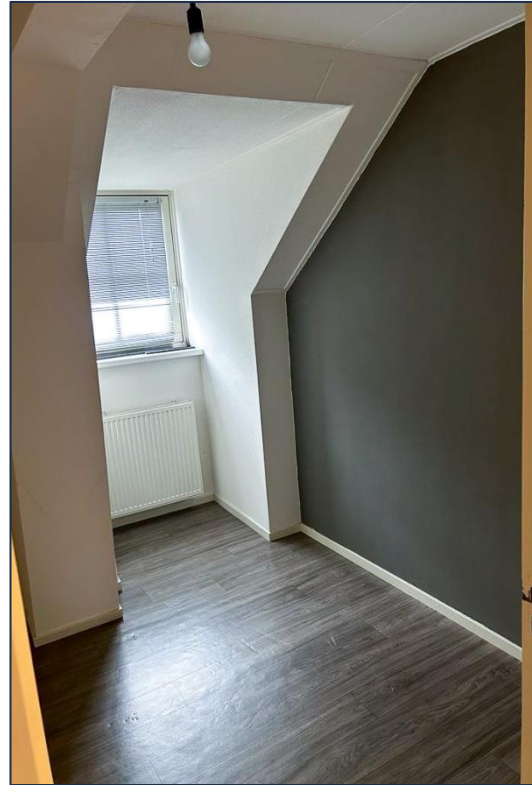
Slaapkamer | Toilet