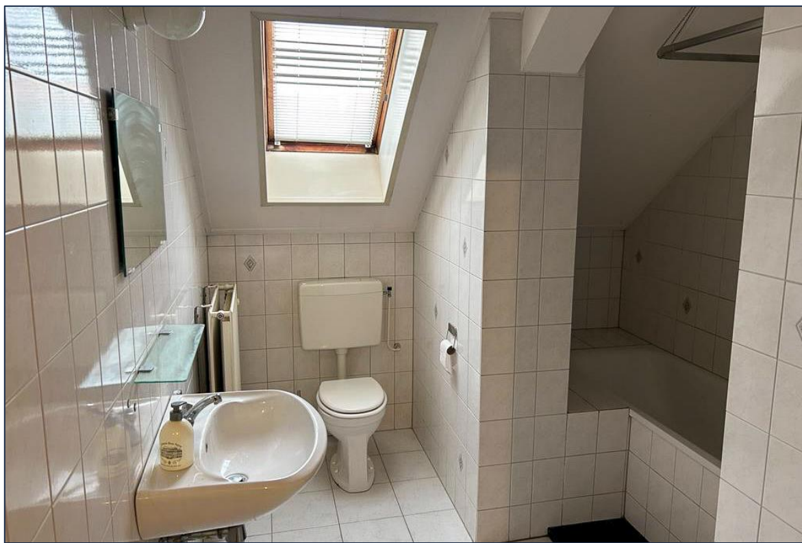
Badkamer | Terras