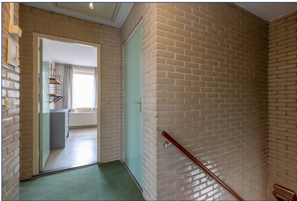
Overloop | Slaapkamer