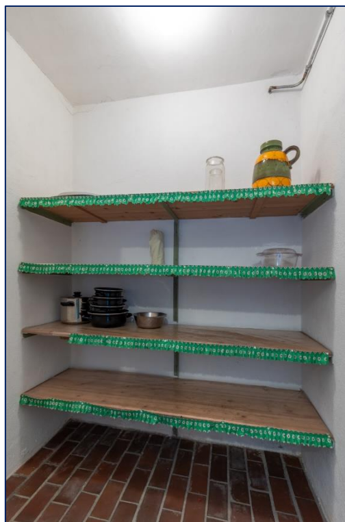
Portaal | Kast | Garage