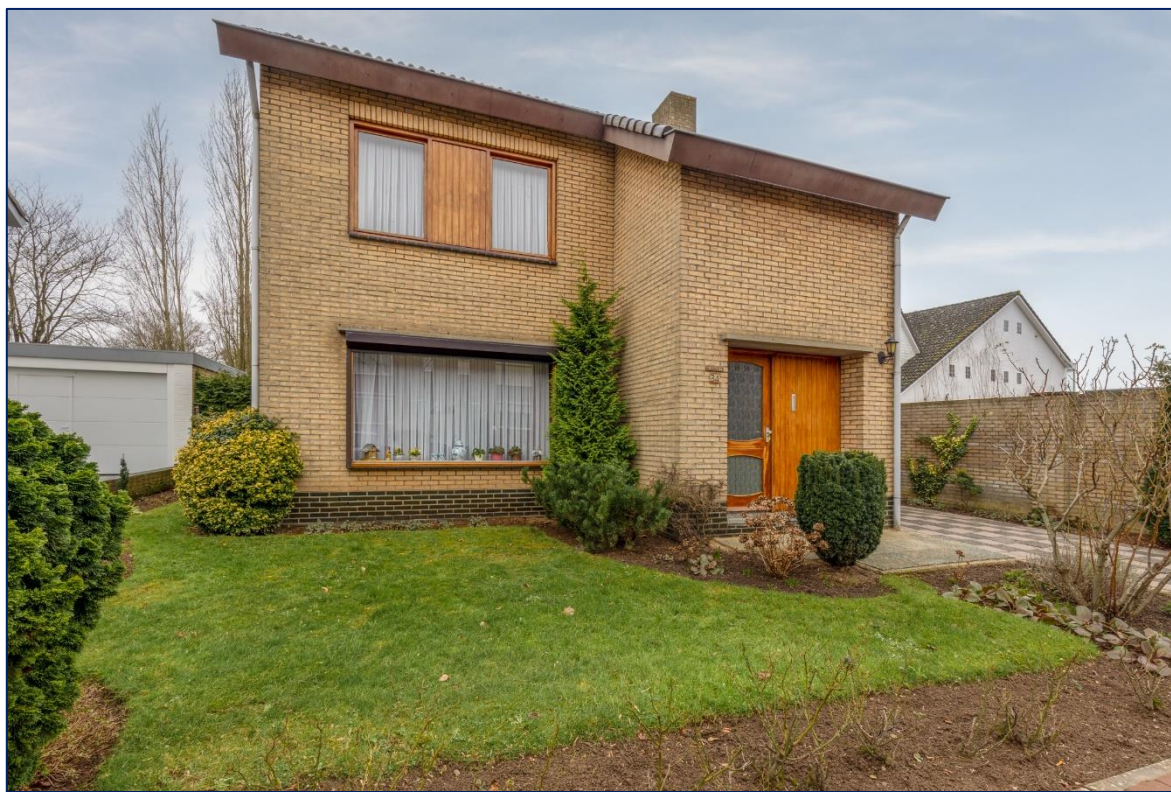
Voorzijde | Hal