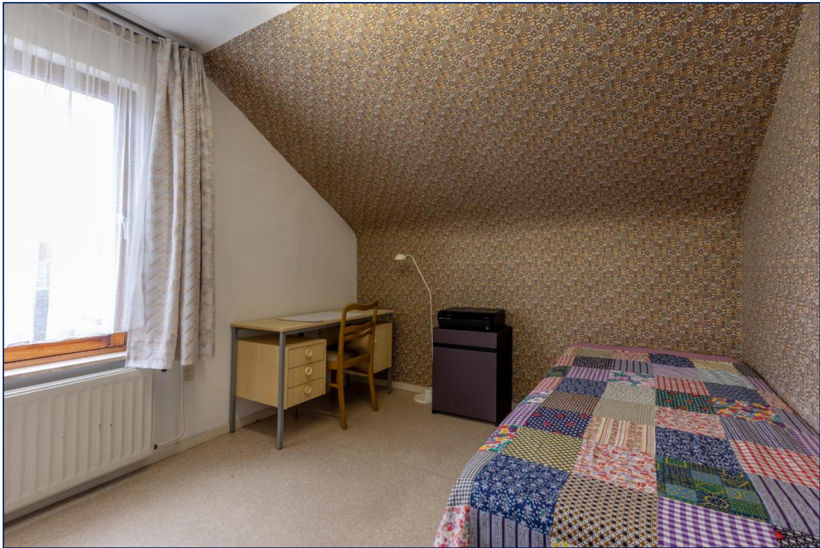
Slaapkamer | Toilet