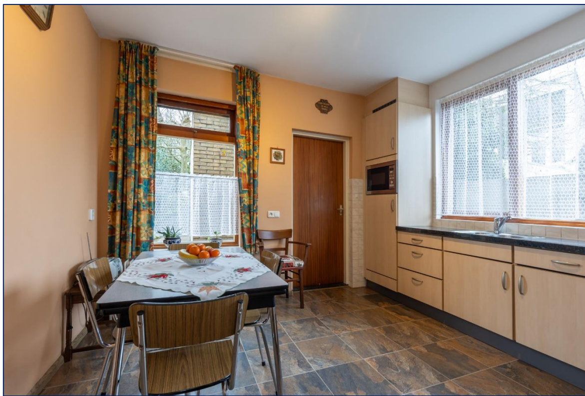
Keuken | Badkamer