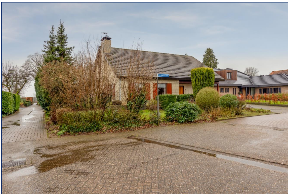
Voorzijde | Groenvoorziening achterzijde