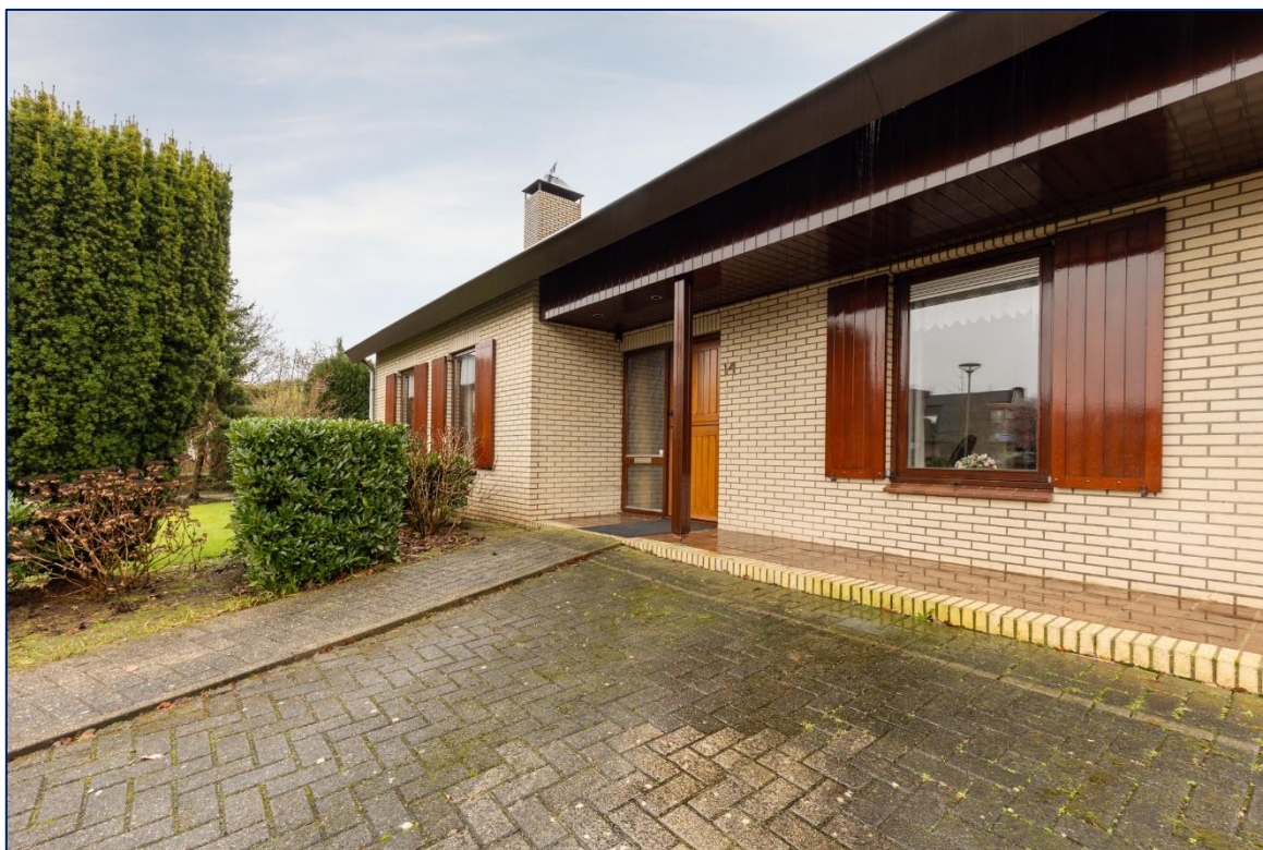
Entrée | Hal