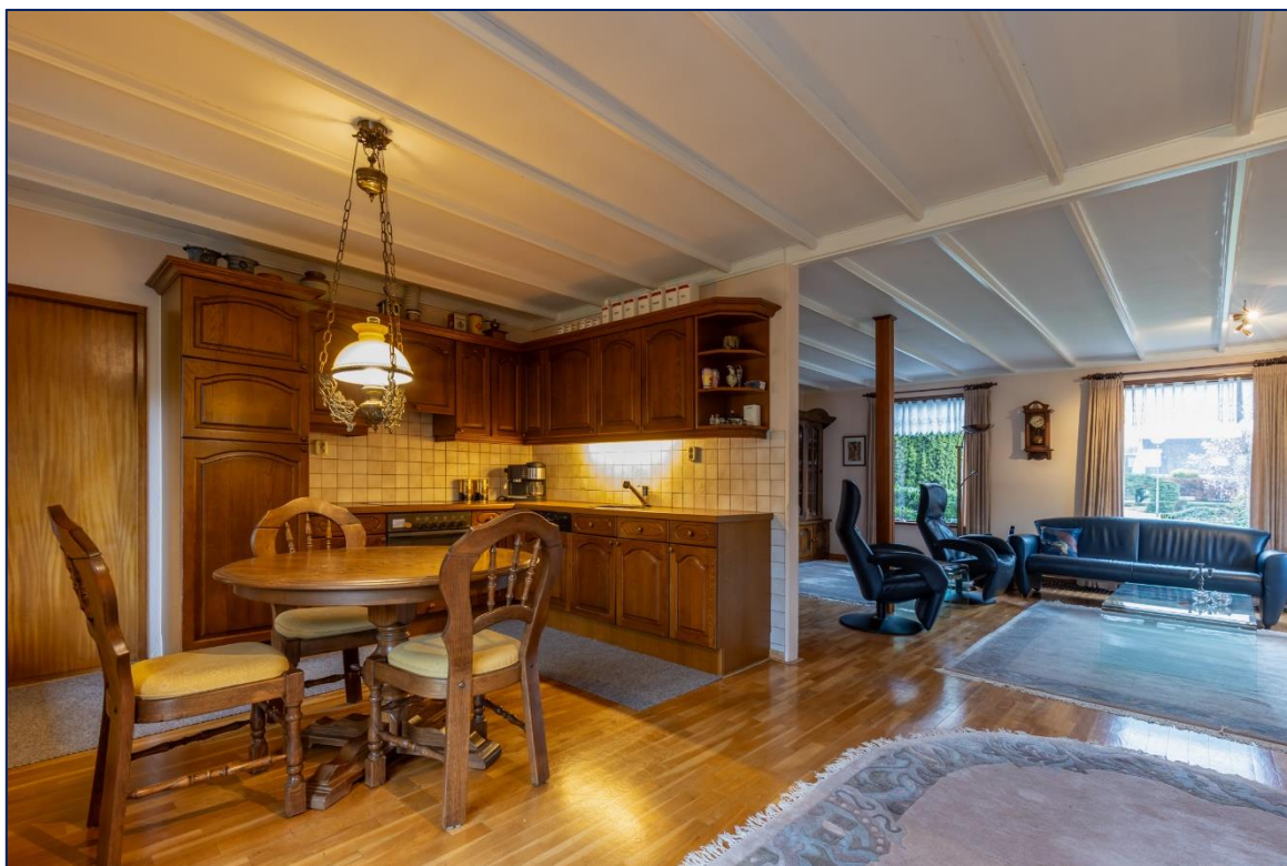
Keuken | Woonkamer