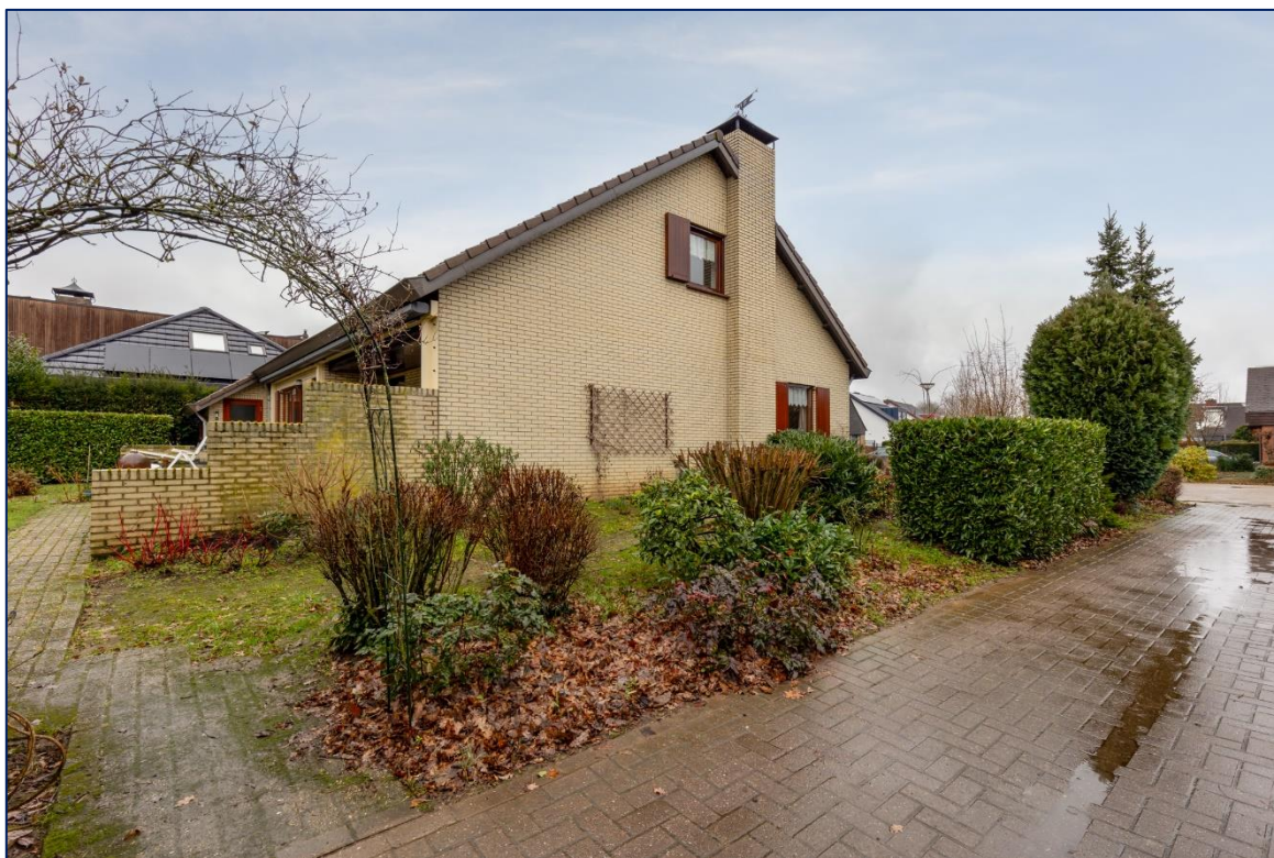
Zij-ingang | Tuin