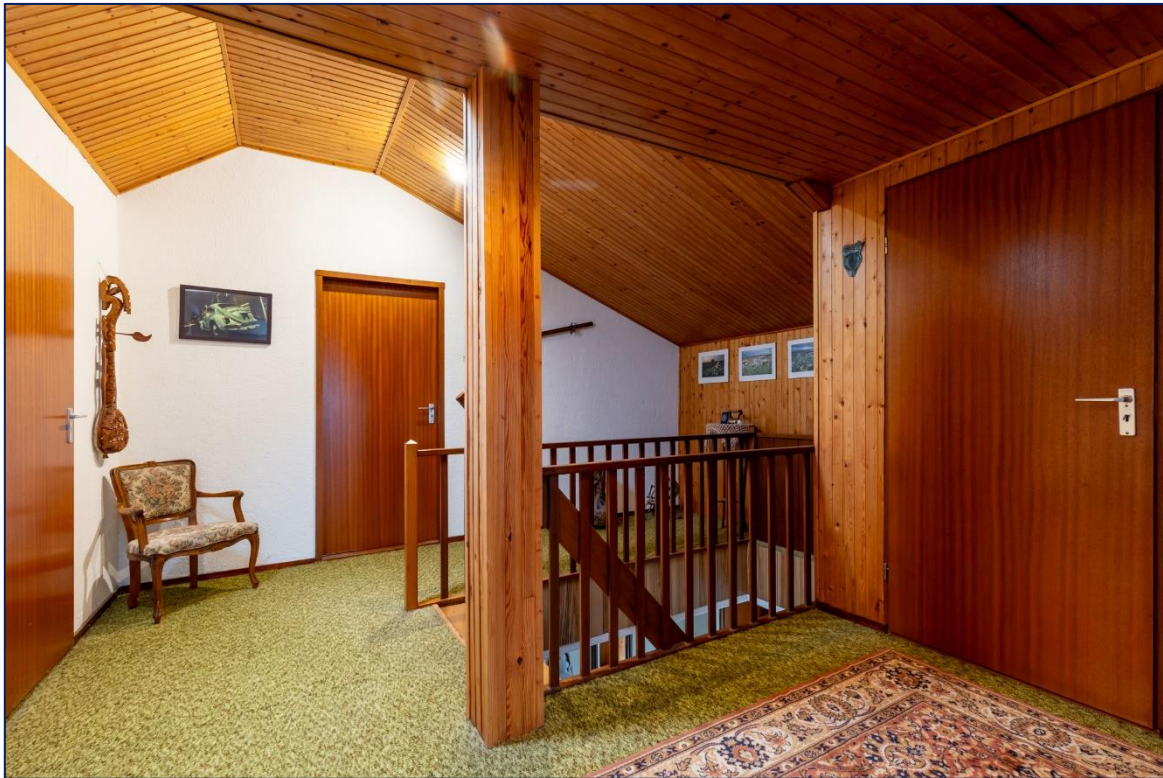
Overloop | Slaapkamer