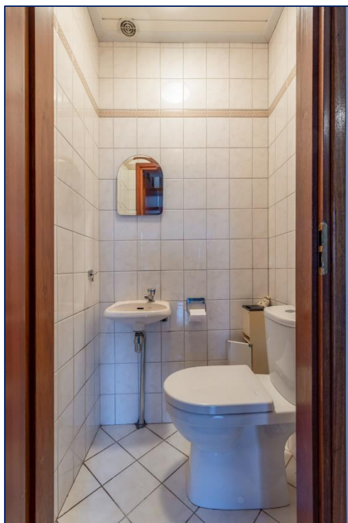
Toilet | Woonkamer