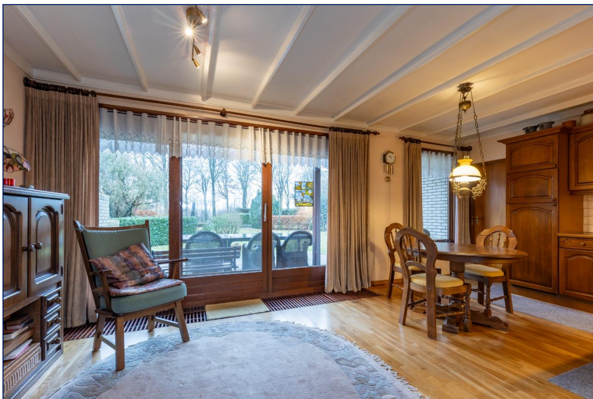
Woonkamer | Keuken