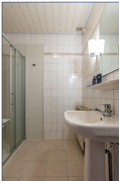
Badkamer | Kantoor