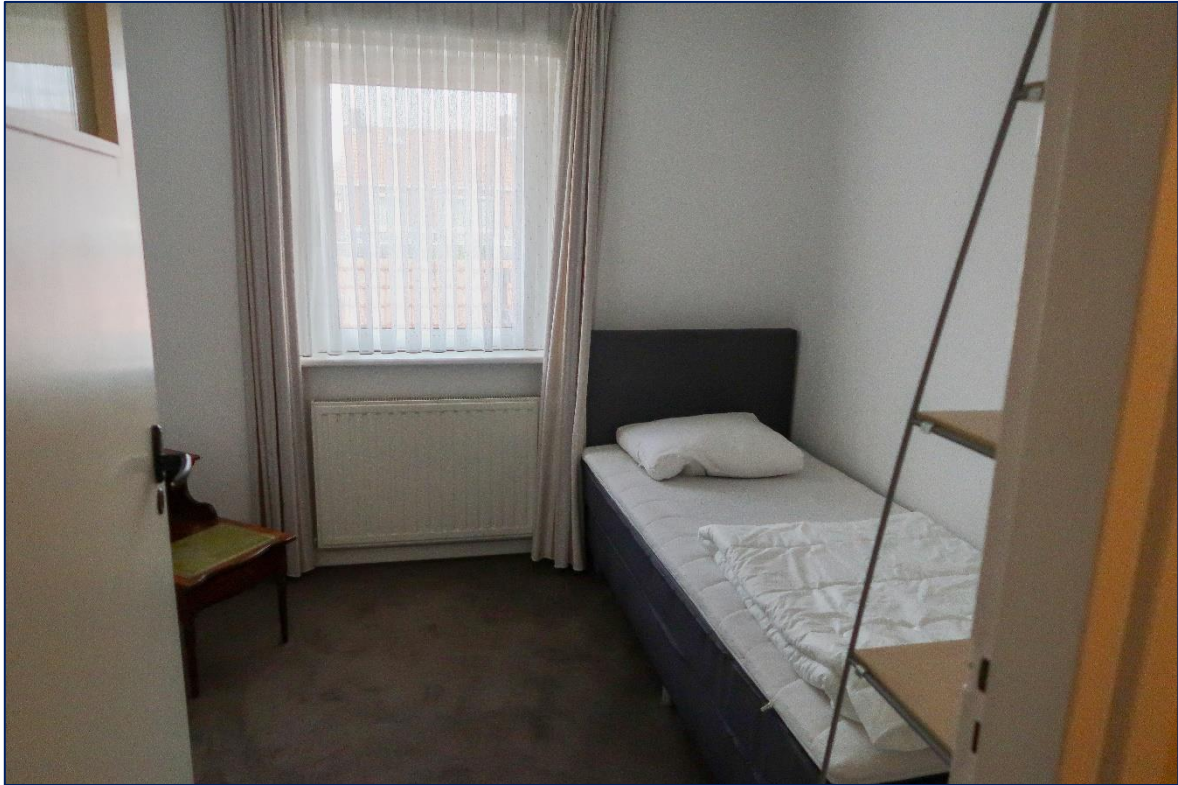
Slaapkamer | Badkamer