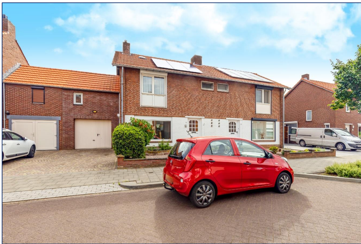
Voorzijde | Hal