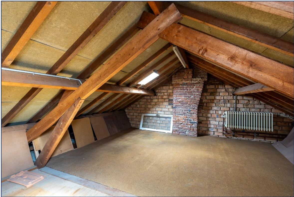
Zolder | Kelder