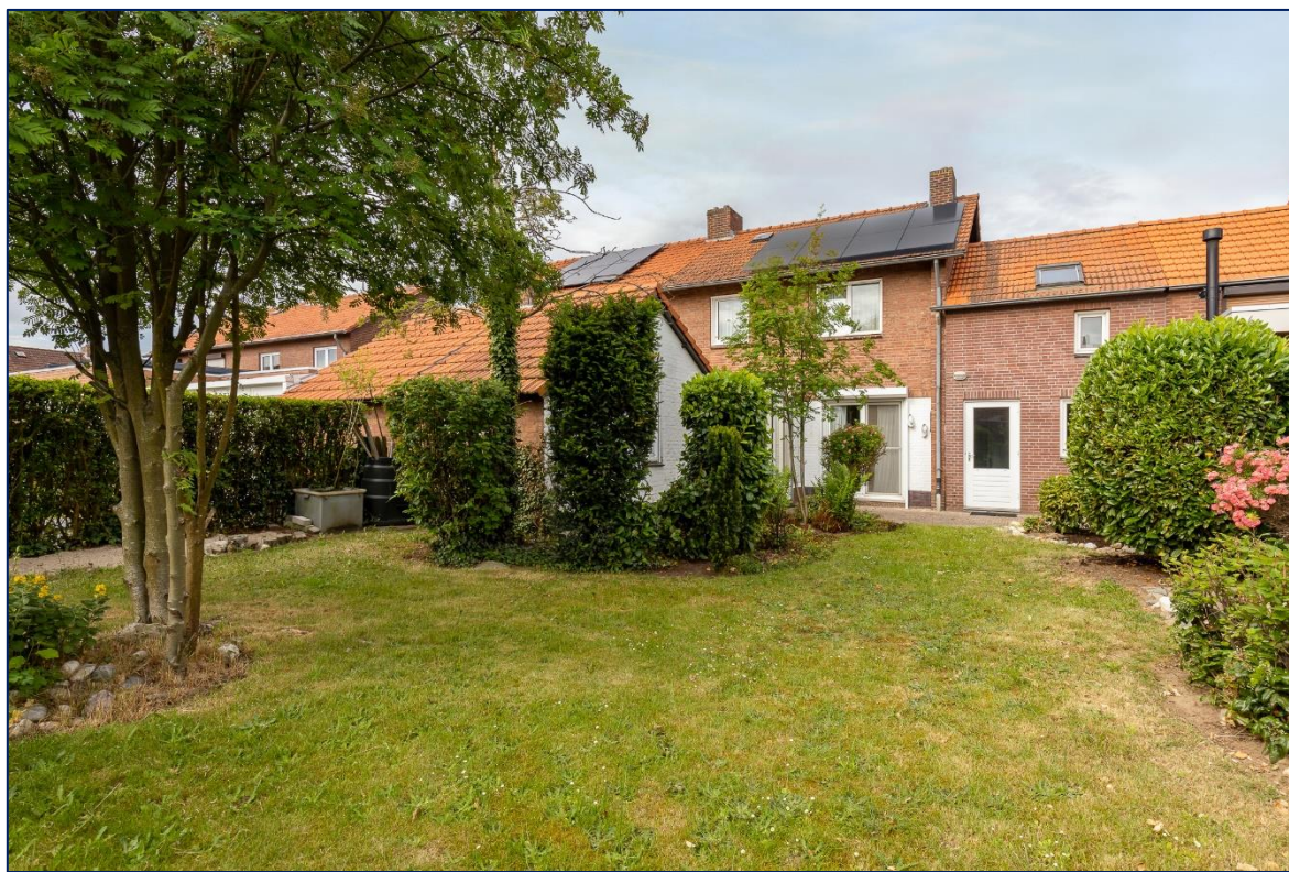
Tuin | Achterzijde