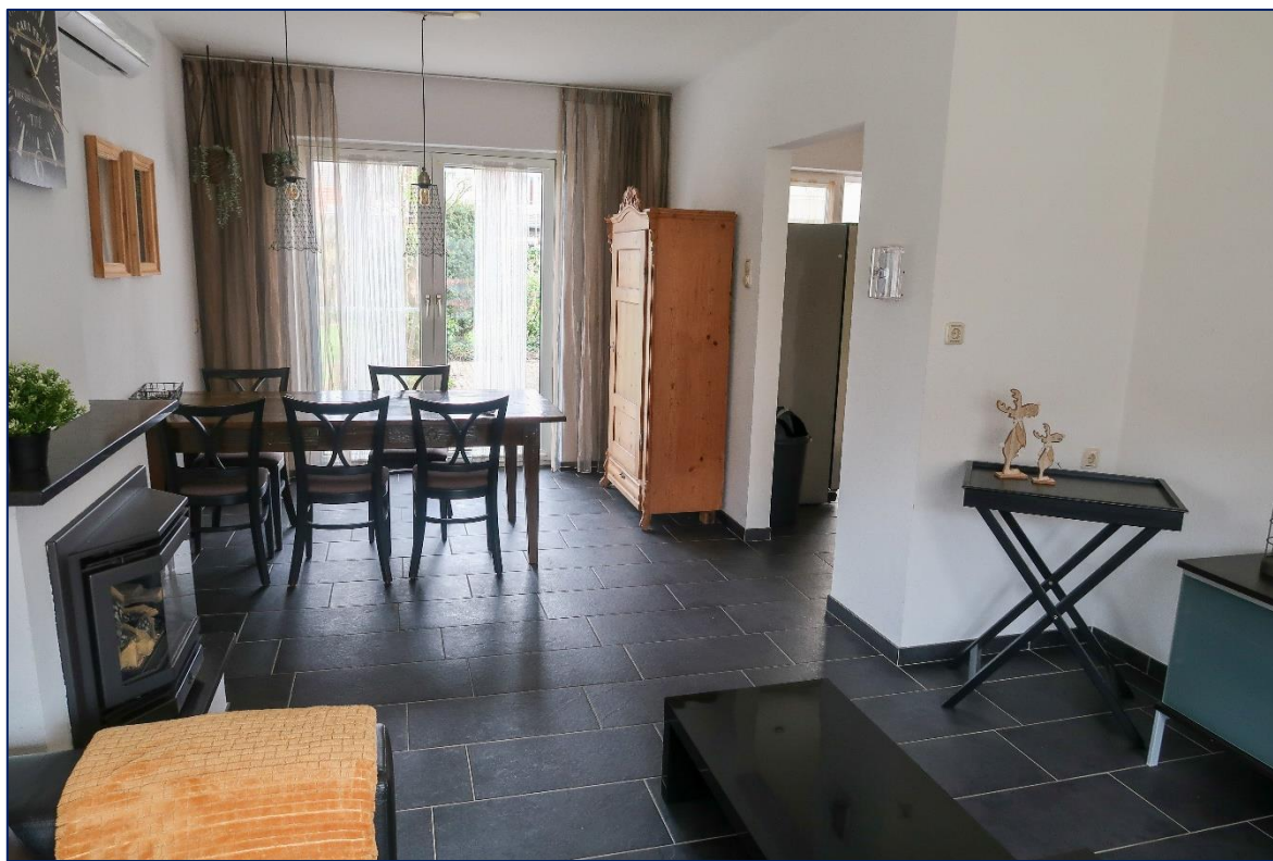
Woonkamer | Keuken