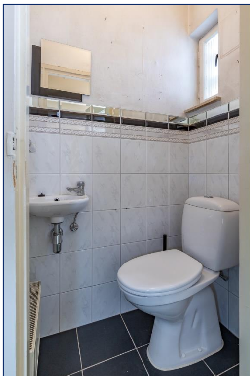
Toilet | Woonkamer