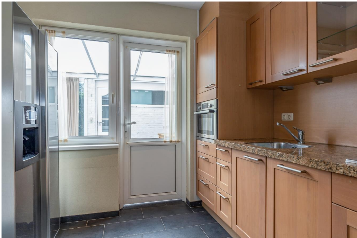
Keuken | Serre