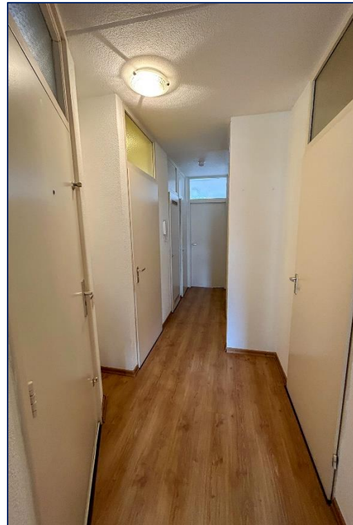
Hal | Gang | Toilet | Berging