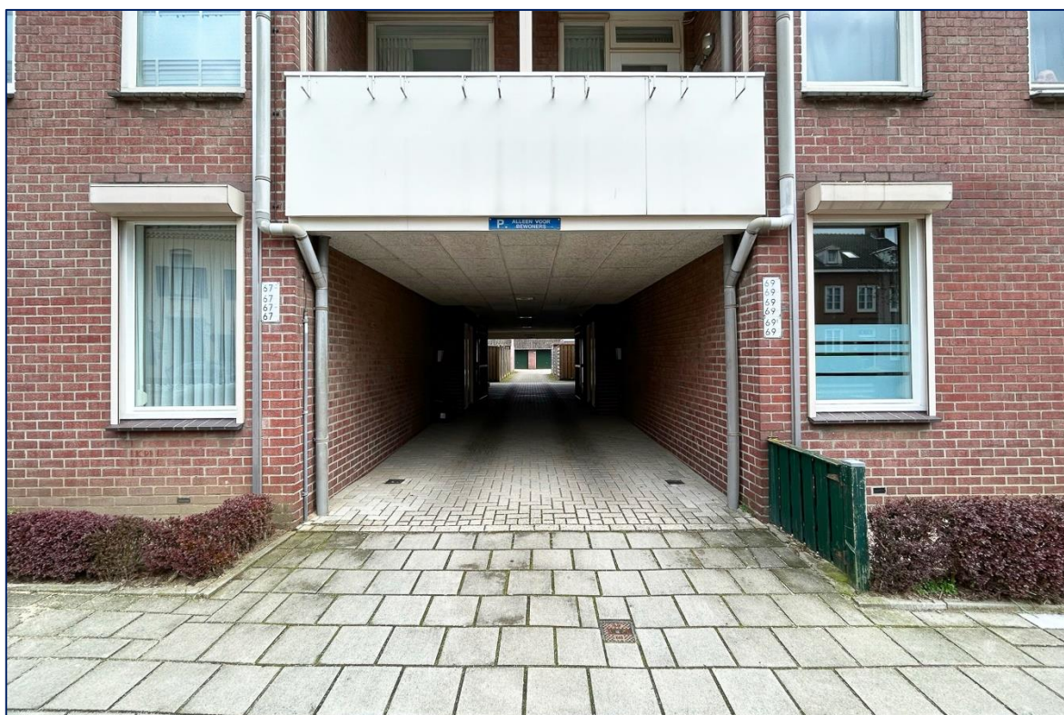
Onderdoorgang entree voorzijde | Achterzijde