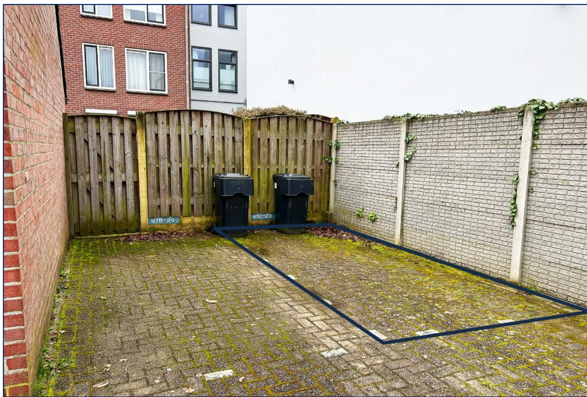
Parkeerplaats | Fietsenberging