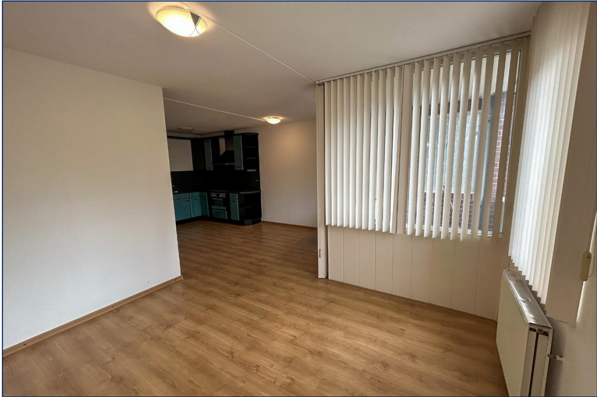
Woonkamer | Keuken