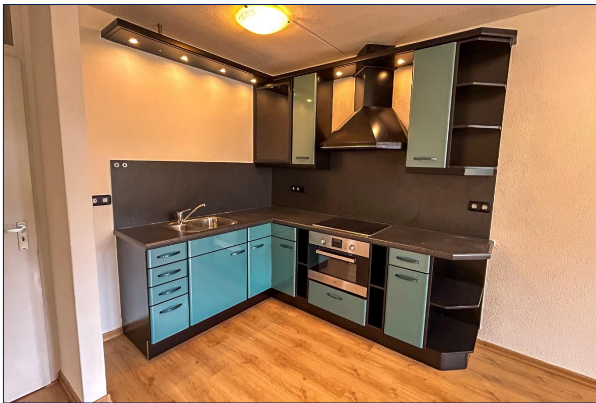
Keuken | Badkamer